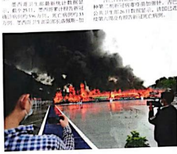
墨西哥首都墨西哥城，一名男子在参加反北约游行。

新华社墨西哥城6月26日电 综合新华社拉美地区电：受新冠病毒感染率上升影响，部分拉美国家收紧防疫政策。墨西哥、巴西和智利等国宣布收紧防疫政策，包括限制集会、关闭学校和企业等。 墨西哥政府宣布收紧防疫政策，包括限制集会、关闭学校和企业等。巴西政府宣布收紧防疫政策，包括限制集会、关闭学校和企业等。智利政府宣布收紧防疫政策，包括限制集会、关闭学校和企业等。