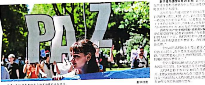
这是6月26日在西班牙马德里举行的游行现场。