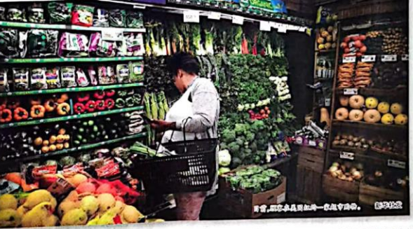
超市,顾客从货架上挑选新鲜农产品。

美国劳工部数据表示，美国消费者价格指数(CPI)同比涨幅已连升8个月，升至6.2%，3个月环比涨幅也在5%以上。美国银行高级经济学家詹姆斯·高利表示，高通胀和供应链紧张，至少在未来几个月内看不到缓解迹象。美国政府面临着国内舆论对其经济政策的质疑和批评。《华尔街日报》撰文指出，当前的通胀“可以说是拜登政府上任以来最严重的经济挑战”。