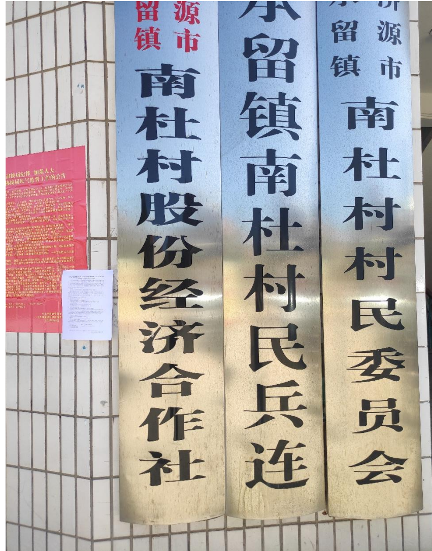
图5 村庄张贴——南杜村