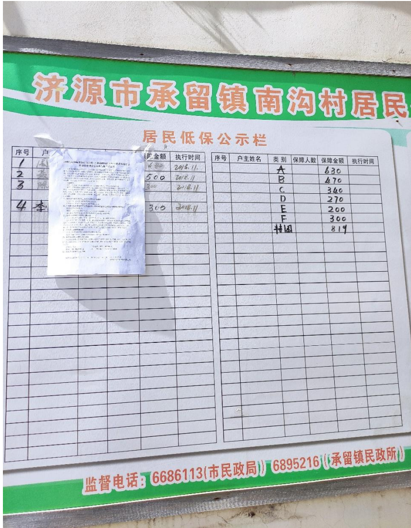
图5 村庄张贴——南沟村