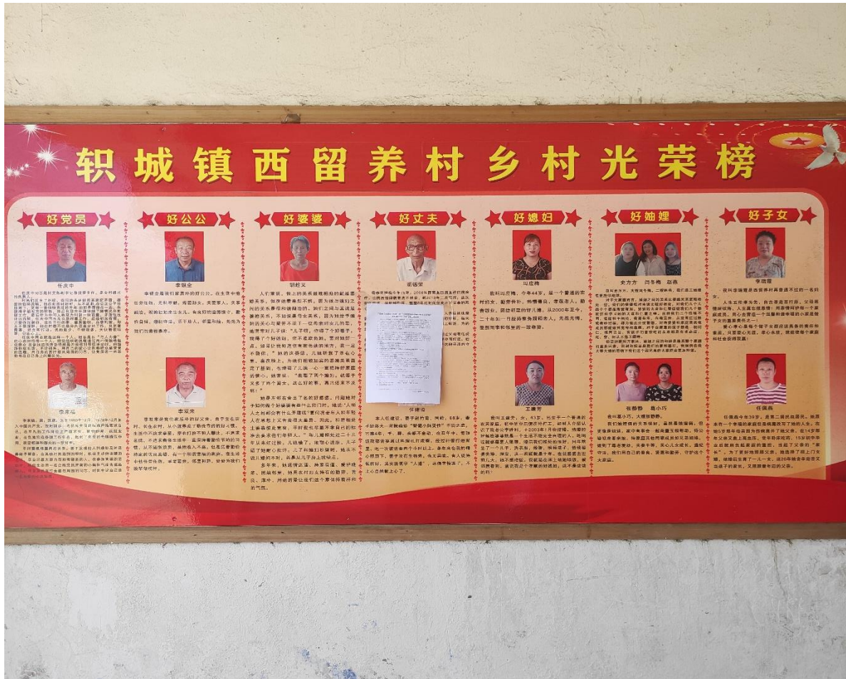
图5 村庄张贴——西留养村

2022年6月我公司在南杜村、南沟村、西留养村等进行了张贴公示，公示中给出了报告书全文、公众意见调查表链接，公示日期为5个工作日。村庄张贴见图5。